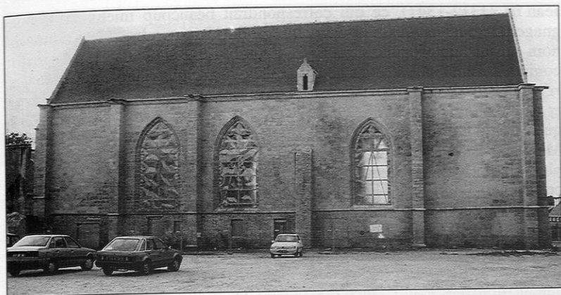
Figure 1 – La chapelle du Saint-Esprit d'Auray, façade nord d'après restauration (premiers travées à gauche, les deux derniers à droite).

ments des XVII e et XVIII e siècles indiquent certainement que plusieurs rentes en nature, dont la maison bénéficiait encore à ce moment-là, étaient à l'origine des donations duciales 8 . Mais de quel duc ou ducs ?